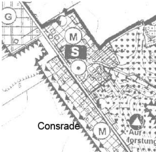
Bild 1 Auszug aus wirksamen Flächennutzungsplan

Im wirksamen Flächennutzungsplan der Gemeinde Plate ist der Bereich des B-Planes Nr. 19 als gemischte Bauflächen (M) dargestellt.